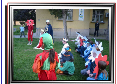
Театарската работилница ќе отпочне со работа кон крајот на ноември

Возрасните можат да се вклучат во работата на Меѓаши со волонтирање или членување.