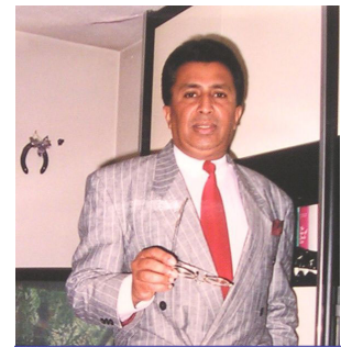
Н.Е. Проф д-р. Пол Ратнајаке