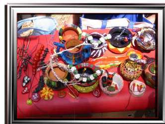
Од работилницата по применета уметност

Годишната членарина изнесува 600,00 денари, а може да се плати и на две