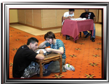
Децата на нивниот настап

реално и со конкретни примери своите животни приказни и проблемите со кои тие се соочувале.