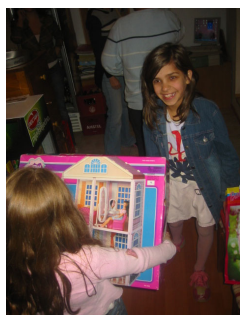
Благородна го прима подарокот од Меѓаши

Изненадувањето за овој месец беше подготвено за